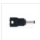
ø4,0mm - ø1,7mm