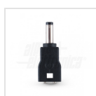
ø4,0mm - ø1,7mm