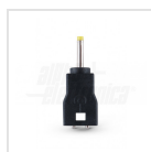
ø2,35mm - ø0,7mm