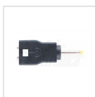
ø2,35mm - ø0,7mm