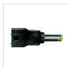
5mm - 1,7mm