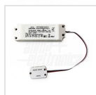
Alimentatore 1050mA corrente costante