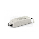
Alimentatore 1050mA corrente costante