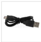
Cavo di alimentazione USB