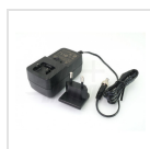
Alimentatore 12Vdc 2,5A