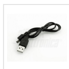
Cavo di alimentazione USB