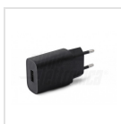
Alimentatore USB 5Vdc 1A