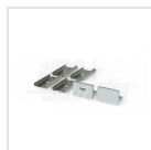
Terminali di chiusura e graffette di fissaggio