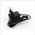
Alimentatore 5Vdc 1A