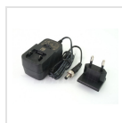
Alimentatore 12Vdc 1A