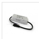
Alimentatore 500mA corrente costante 25-42Vdc