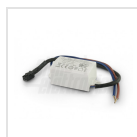
Alimentatore 400mA corrente costante