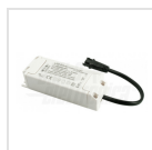
Alimentatore 460mA corrente costante