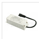
Alimentatore 230mA corrente costante