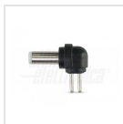
Ø5,5 - 2,5mm