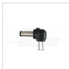
Ø5,0 - 2,1mm