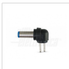
Ø5,5 - 2,1mm