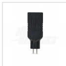
USB tipo "A"