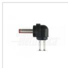
Ø3,5 - 1,35mm