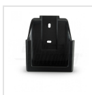
Base porta telecomando