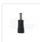
Ø5,5 - 2,1mm