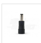
Ø5,5 - 2,5mm