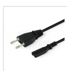
Cavo d'ingresso con spina Europa