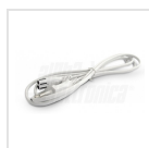
Cavo di alimentazione con spina 2 poli