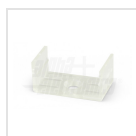
Ganci di fissaggio