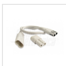
Set connettore e cavo per collegamento in serie