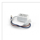
Alimentatore 400mA corrente costante