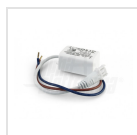
Alimentatore 400mA corrente costante