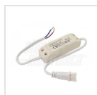
Alimentatore 500mA corrente costante