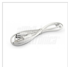
Cavo di alimentazione con spina 2 poli

Bianco naturale - 4000K - 1260lm - 12W - 230Vac - IP20 - Bianco