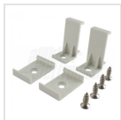
Ganci di fissaggio