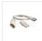
Set connettore e cavo per collegamento in serie