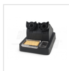
Calamaio porta stilo e pompetta dissaldante