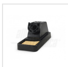
Calamaio porta stilo saldante