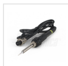
Saldatore a stilo (Lunghezza cavo 110cm)