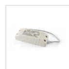
Alimentatore 700mA corrente costante