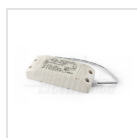
Alimentatore 700mA corrente costante