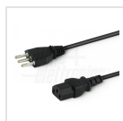
Cavo ingresso con spina Italia