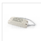
Alimentatore 700mA corrente costante