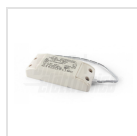
Alimentatore 700mA corrente costante