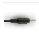
ø5,5 - 2,5mm