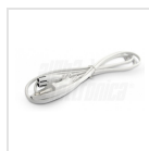
Cavo di alimentazione con spina 2 poli