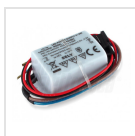
Alimentatore 350mA corrente costante - Dimensioni 58,1x28,5x21mm