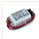
Alimentatore 500mA corrente costante