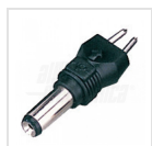
5,5mm - 2,1mm

* se la corrente di mantenimento assorbita dalla batteria rimane maggiore di 30mA anche quando essa è completamente carica, allora il led non si spegne.