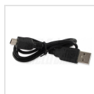
Cavo di alimentazione USB