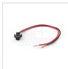
Cavetto con connettore - 15cm