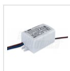
Alimentatore 350mA corrente costante - Dimensioni 36.6x26.2x21mm