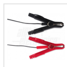
21 - Pinze e occhielli