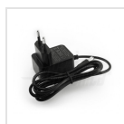
Alimentatore 5Vdc 2A