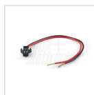
Cavetto con connettore - 15cm