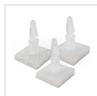
Piedini di supporto