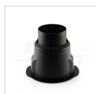
Cassaforma in plastica