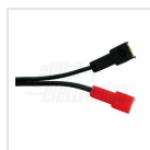
22 - Faston 6,3mm