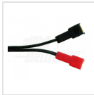
22 - Faston 6,3mm