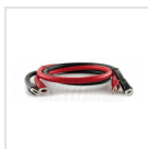
Cavo di ingresso 22mm 2 occhielli Ø8mm / Ø12mm