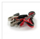
Cavo di ingresso 8mm² forcelle e pinze