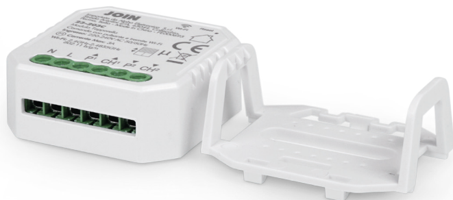
Con clip di montaggio