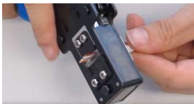
6 - Controllare la posizione.