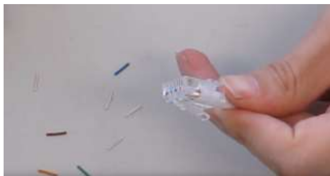
8 - Verificare. Il connettore è pronto!