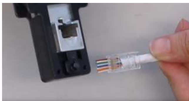
5 - Inserire il connettore e il cavo nella pinza