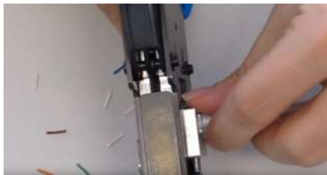
7 - Chiudere la pinza lentamente con forza.