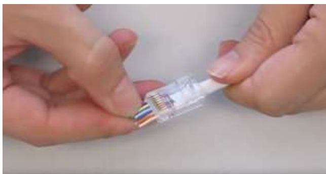
4 - Inserire i cavi nel connettore.