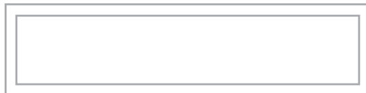
J0395/30120 30x120 cm